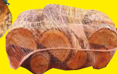
DREWNO KOMINKOWE GRUBE