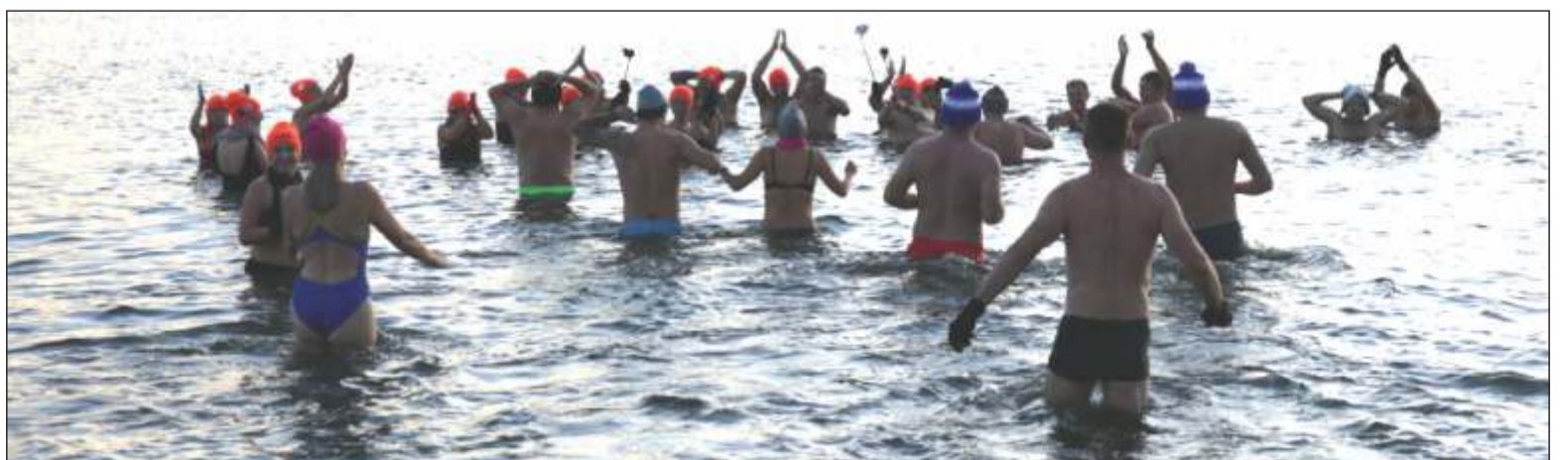
Śremski Klub Morsów Łodziki Śrem rozpoczął tegoroczny sezon inauguracyjną kąpielą w jeziorze Grzymiśławskim 23 października