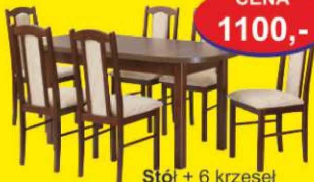
Stół + 6 krzesel