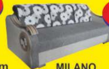
MILANO pow. spania: 190x145 cm