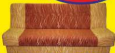
Kanapa BEATA pow. spania 193/110