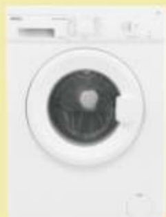
Pralka Amica NAWT6101WSW