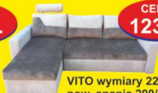
VITO wymiary 226/157cm pow. spania 200/140cm