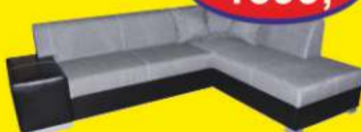
Narożnik PITER wymiary 280/200 pow. spania 205/125