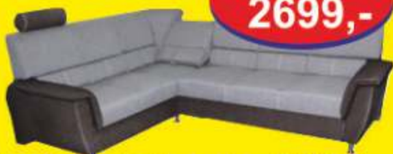
Narożnik EDEN wymiary 270/215 pow. spania 205/125