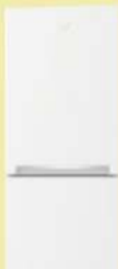
Chłodziarko-Zamrażarka BEKO RCSA240M20

Duży wybór piekarników i sprzętu do zabudowy