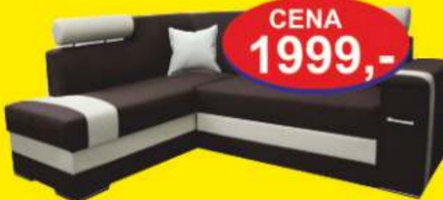
Narożnik HUGO wymiary 250/200 pow. spania 205/135