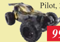
SAMOCHÓD OV- RALLY RC Pilot, 25 km/godz.

Bezprzewodowy Czas odkurzania 40 minut Łatwe czyszczenie elektroszczotki