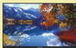
Telewizor Thomson 32HD5506

Przekątna obrazu: 50 cali Rozdzielczość 4K UHD SMART TV Technologia obrazu HDR