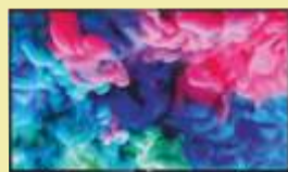
TV Philips 50PUS6503

Szerokość 50 cm. Obieg gorącego powietrza Programator elektroniczny. 8 funkcji piekarnika.