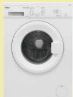
Pralka Amica NAWT6101WSW