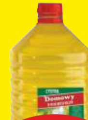
Płyn do naczy Delko 5l. 7,50 zł