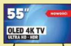
Telewizor Samsung QE55Q60R