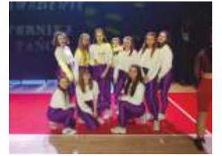
...tak jak ich starsze koleżanki z grupy I-Gyals, które również stanęły na piątym miejscu