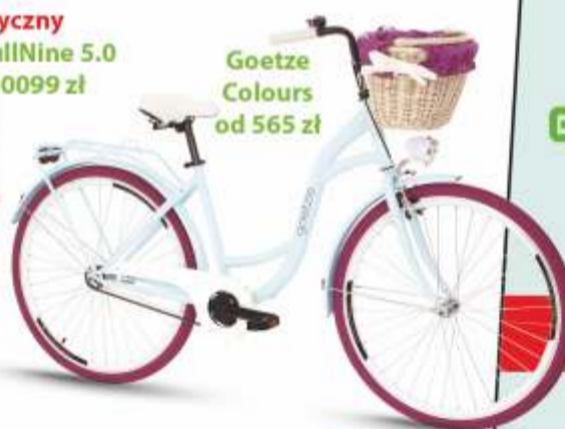
Goetze Colours od 565 zł