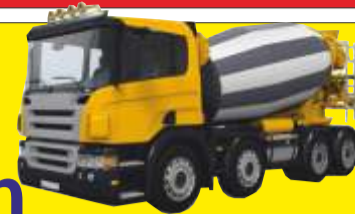
Beton towarowy z pompy lub bez