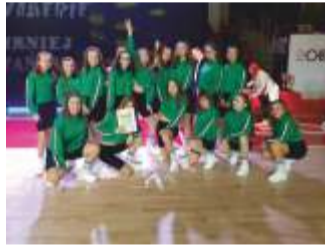
Formacja Mad Squad zajęła drugie miejsce

Ostatnie tygodnie są naprawdę... taneczne. Za dziewczynami z formacji Mad Squad, Likkle Chaka i I-Gyals kolejny turniej tańca, tym razem „Wiosenne Fanaberie” organizowany przez Miejski Ośrodek Kultury w Gostyniu. Tancerki znów poradziły sobie znakomicie, a na parkiecie pokazały, na co je stać. Tak trzymaj!