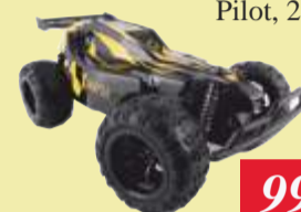
SAMOCHÓD OV- RALLY RC Pilot, 25 km/godz.

Przekrój 55 cali Zgodny z HD 4K Ultra HD Smart TV Gniazdko HDMI 4 sztuki QLED