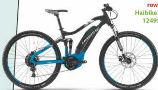
rower elektryczny Haibike Sduro FullNine 5.0 12495 zł → 10099 zł

Śrem , ul.Farna 1 / Rynek / Tel. 61 28 30 087