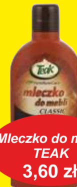
Mleczko do mebli TEAK 3,60 zł