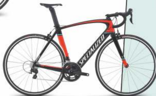
Specialized Venge Elite 12099 zł → 9799 zł