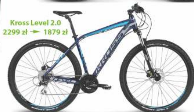
Kross Level 2.0 2299 zł → 1879 zł