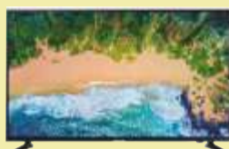
TV Samsung UE50NU7092

Szerokość 50 cm. Obieg gorącego powietrza Programator elektroniczny. 8 funkcji piekarnika.