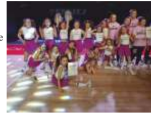
Dziewczyny z Likkle Chaka uplasowały się na miejscu piątym w swojej kategorii...