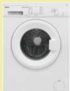
Pralka Amica NAWT6101WSW