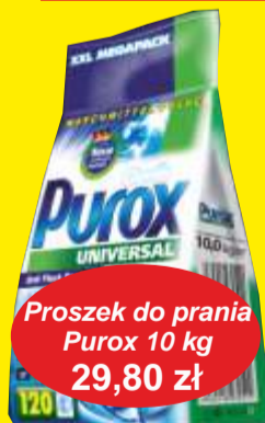
Proszek do prania Purox 10 kg 29,80 zł