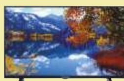
Telewizor Thomson 32HD5506

Rozdzielczość 3840x2160 (4K Ultra HD) piksele przekrój ekranu: 50 cali współczynnik płynności obrazu: 1300 Smart TV