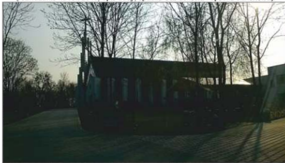
Pierwsza trasa: Czerwona – Podwyższenia Krzyża Świętego: Śrem – Gogolewo – 43 km

NASZĄ REJONOWĄ EKSTREMALNĄ DROGĘ KRZYŻOWĄ Śrem – Gogolewo ROZPOCZNIEMY 12 KWIEŚNIA 2019r. od Mszy św. w kościele pw. Mądrości Bożej w Śremie (Park Odlewnika) o godz.20.00, z poświęceniem Krzyży oraz na koniec z indywidualnym błogosławieństwem na drogę. Przed Mszą św., w salce parafialnej od godz. 19.00 – 20.00, oraz zaraz po jej zakończeniu, osoby które zadeklarują przejście EDK w Rejonie Śrem przez stronę, będą mogły nabyć całoroczny pakiet pamiątkowy: (rozważanie na rok 2019, opis trasy, opaska odbłaskowa i opaska silikonowa).