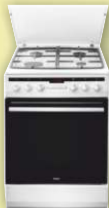
Kuchnia Amica 57GE2.33HZpTaW

Załadunek 7 kg 400 - 1000 obr/min. Klasa energ A+++ technologia 6 myseł