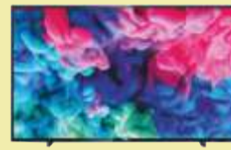
Telewizor Philips 50PUS6503