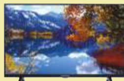
Telewizor Thomson 32HD5506

Rozdzielczość 3840x2160 (4K Ultra HD) piksele przekątna ekranu: 50 cali współczynnik płynności obrazu: 1300 Smart TV