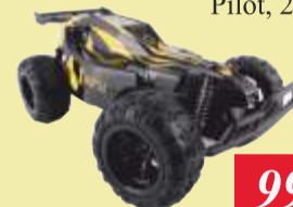
SAMOCHÓD OV- RALLY RC Pilot, 25 km/godz.

Rozdzielczość 4K 50 cali Smart TV, WiFi Index 900Hz