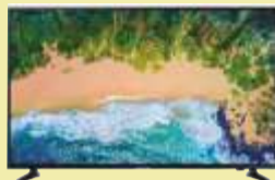
TV Samsung UE50NU7092

Szerokość 50 cm. Obieg gorącego powietrza Programator elektroniczny 8 funkcji piekarnika.