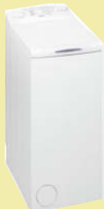
Pralka Whirlpool TDLR 70122