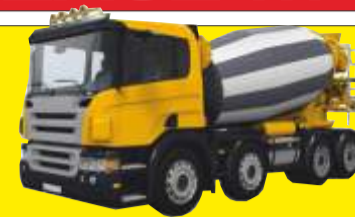
Beton towarowy z pompy lub bez