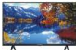
Telewizor Thomson 32HD5506

55 cali Rozdzielczość 4K Ultra HD Smart TV Gniazda HDMI - 3 sztuki