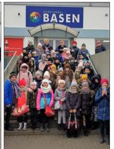
Zajęcia sportowe na lodowisku i basenie w Kościanie