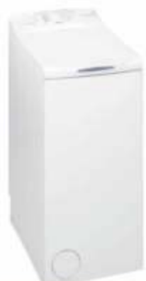
Pralka Whirlpool TDLR 70122