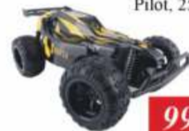
SAMOCHÓD OV- RALLY RC Pilot, 25 km/godz.

Rozdzielczość 4K 50 cali Smart TV, WiFi Index 900Hz