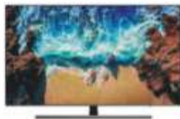
TV Samsung UE55NU8002

Szerokość 50 cm. Obieg gorącego powietrza Programator elektroniczny. 8 funkcji piekarnika.