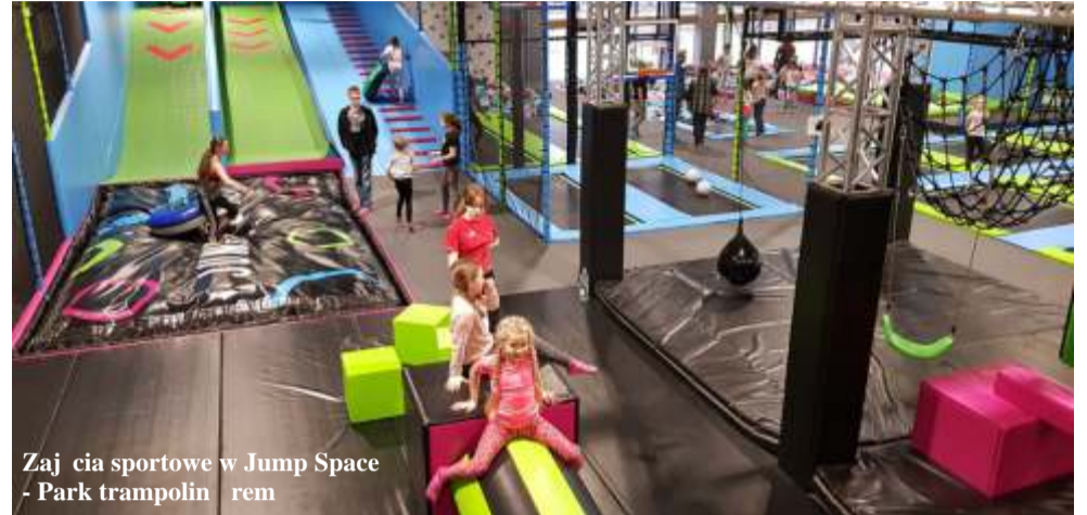
Zajęcia sportowe w Jump Space - Park trampolin w remie