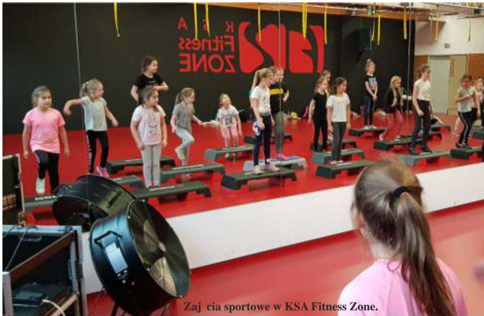
Zajęcia sportowe w KSA Fitness Zone.