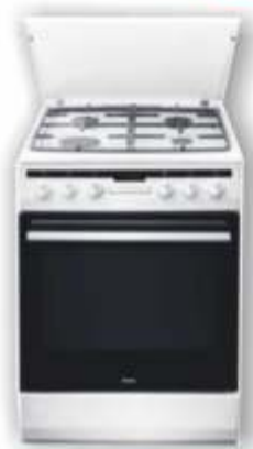
Kuchnia Amica 57GE2.33HZpTaW

Zaladunek 7 kg 400 - 1000 obr/min. Klasa energ A+++ technologia 6 zmysl