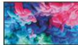
Telewizor Philips 50PUS6503